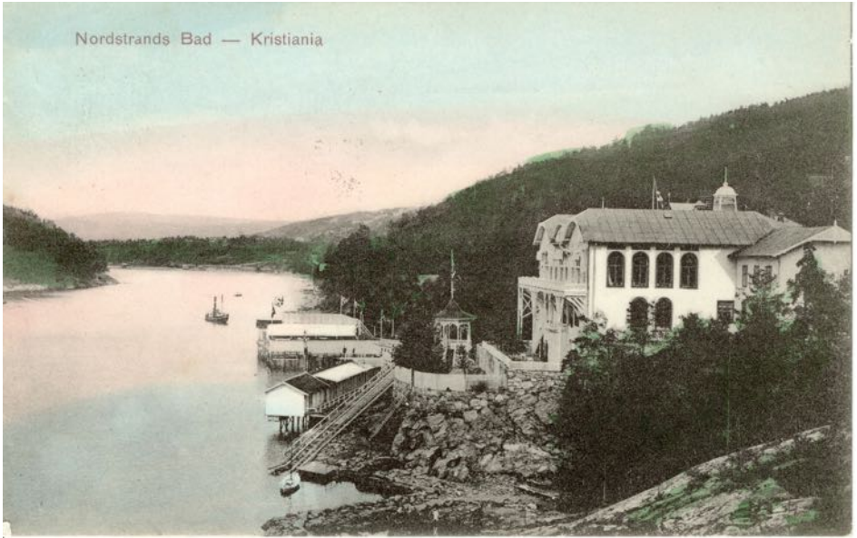
Over: Nordstrand Bad 1918