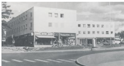
Forretningseiendommen stod ferdig i 1959, Nordstrand Velhus er fløyen til høyre.

I Ekebergveien 228 C har det tilnærmet vært full utleie av lokalene gjennom hele året, og det er ingen store etterslep i leieinnbetalinger. Nordstrand Velhus AS er medlem av Sæterkrysset Gårdeierforening , der selskapet er en av stifterne.