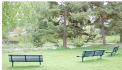
Ny benker ved Andersendammen

Vi har i flere år jobbet med å få det penere rundt Andersendammen. Park og Idrett har satt opp noen ”sperre-stener” og bydelen har bidratt med benker. Søndre Aker Historielag og Vellet spleiser på arbeidet. Vi skulle gjerne hatt en ”grense” ut mot Midtåsen.