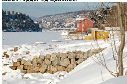
Her jobbes det vinteren 2010/2011

Det er ryddet kraftig i krattet. Diverse arbeid er i gang. Området planlegges som et aktivitetssenter for ungdom – med klatrevegger og lignende.